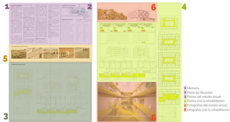
Ejemplo de paneles A3 y contenido

II. Parte informativa: una breve memoria de 5 páginas como máximo explicando la actuación en el que se incluya una descripción de 400 palabras sobre este criterio de evaluación: