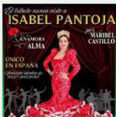
SE ME ENAMORA EL ALMA