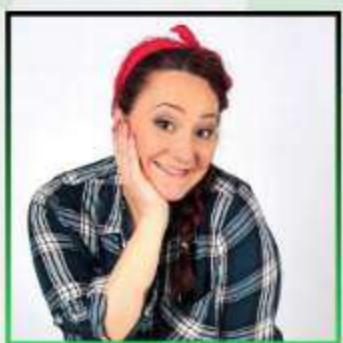
EVA Y QUÉ