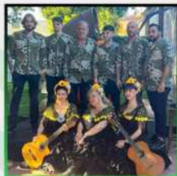
GRUPO ROCIERO ARTE PAYA