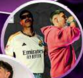
MDO & RAULMC