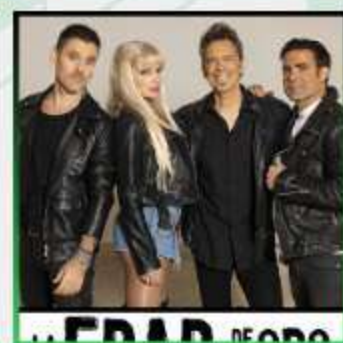
LA EDAD DE ORO DEL POP