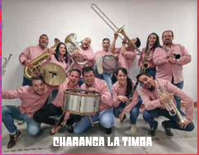
CHARANGA LA TIMBA