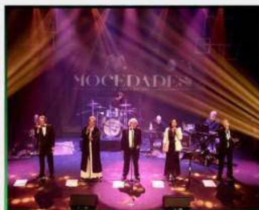
MOCEDADES CON LA BANDA DE MUSICA DE FUENTE ÁLAMO