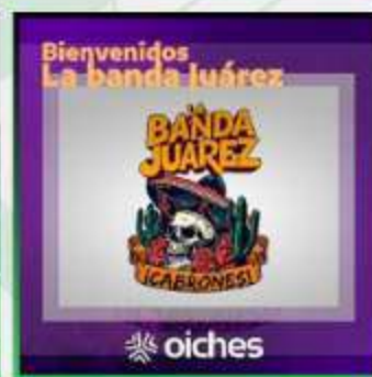
LA BANDA JUAREZ