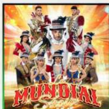
LA MUNDIAL ORQUESTA SHOW