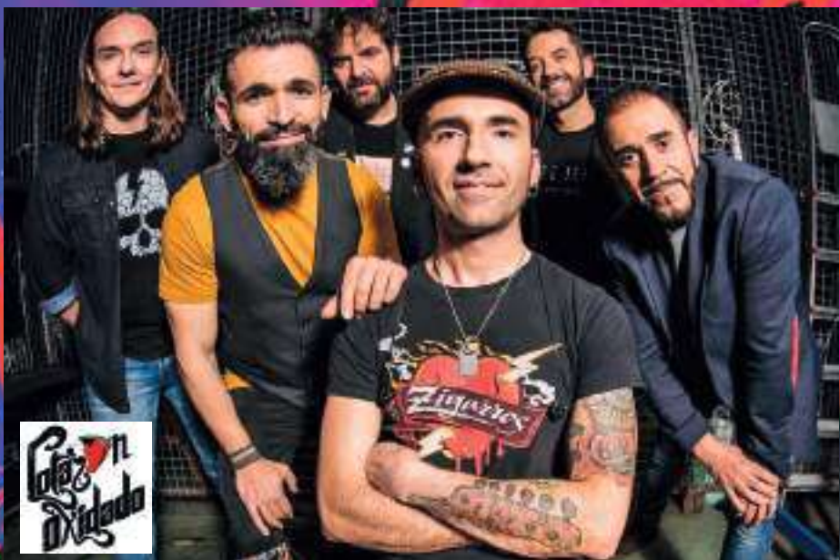
Café en Dixieland