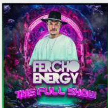
FERCHO ENERGY FULL SHOW